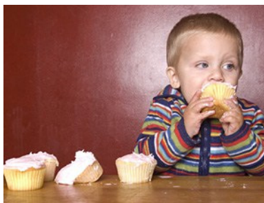
Zu viel Süßes, zu wenig Gemüse - Kinder übernehmen das Essverhalten ihrer Eltern.